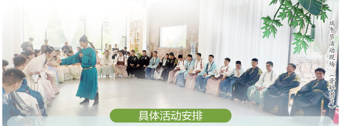
端午节活动现场(资料图摄)