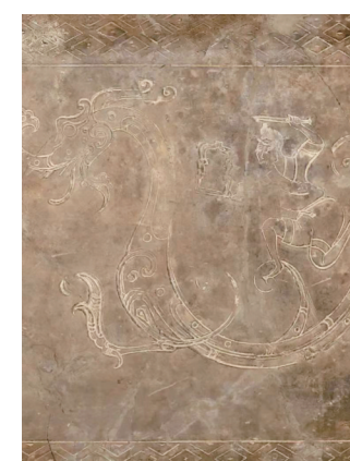
武士御龙画像砖图案一部分