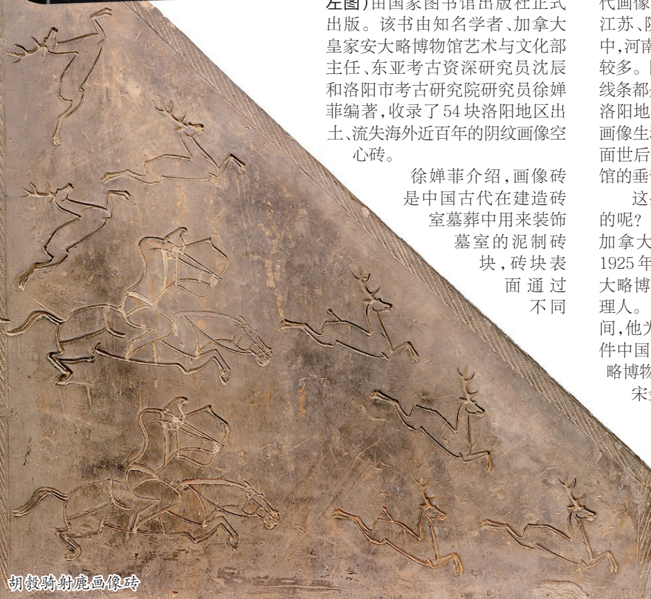
胡髻骑射鹿画像砖