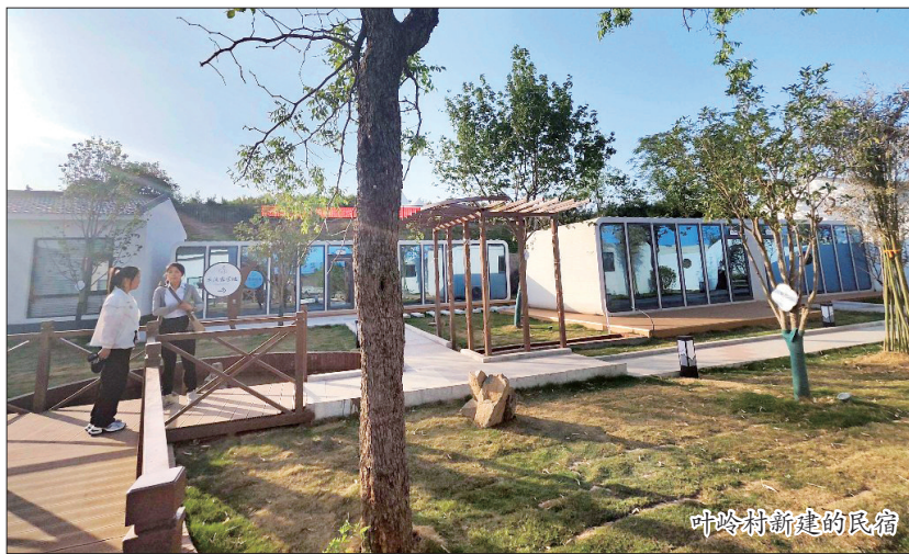
叶岭村新建的民宿

去年11月,叶岭村与嵩县乡村振兴局结对为联学联建单位。随后,嵩县乡村振兴局、城关镇与叶岭村多次召开会议。在一次次的商讨中,叶岭村的发展思路进一步明确——采取做强丹参产业与引进新业态相结合的发展思路,推动村子农文旅深度融合。