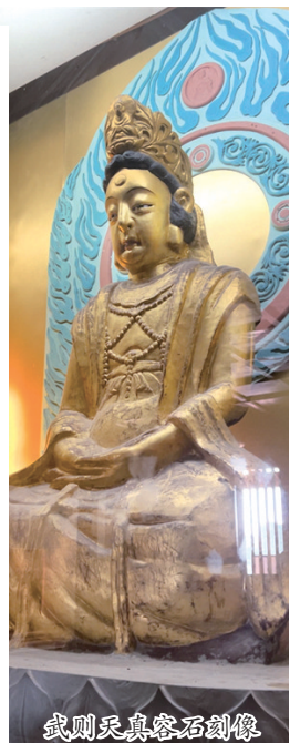
武则天真容石刻像

昨日,由龙门石窟研究院、广元石窟研究所、洛阳日报社联合推出的“云上龙门牵手广元石窟”大型直播活动推出第四场。广元石窟研究所副研究员唐志工以《武则天与广元》为题,为大家讲述皇泽寺背后的历史故事。