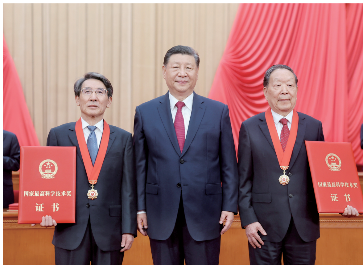
6月24日,全国科技大会、国家科学技术奖励大会和中国科学院第二十一次院士大会、中国工程院第十七次院士大会在北京人民大会堂隆重召开。中共中央总书记、国家主席、中央军委主席习近平出席大会并发表重要讲话。