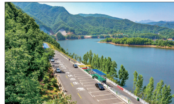
生态伏牛1号旅游公路庙子段(资料图片)

本报讯(洛报融媒记者 戚帅华)日前,《全国县域旅游发展研究报告2024》发布,在2024年全国县域旅游综合实力百强县榜单上,栾川县榜上有名。据悉,《全国县域旅游发展研究报告2024》由全国县域旅游研究课题组、华夏佰强旅游咨询中心联合发布。县域旅游综合实力研究从旅游经济发展水平、政府推动作用、旅游产业综合带动功能、旅游开发与环境保护、旅游设施与服务功能、旅游质量监督与市场监管等方面进行综合评分,反映了我国县域旅游发展水平和质量。其中,我省登封市、栾川县、中牟县获评“2024中国县域旅游综合实力百强县市”。