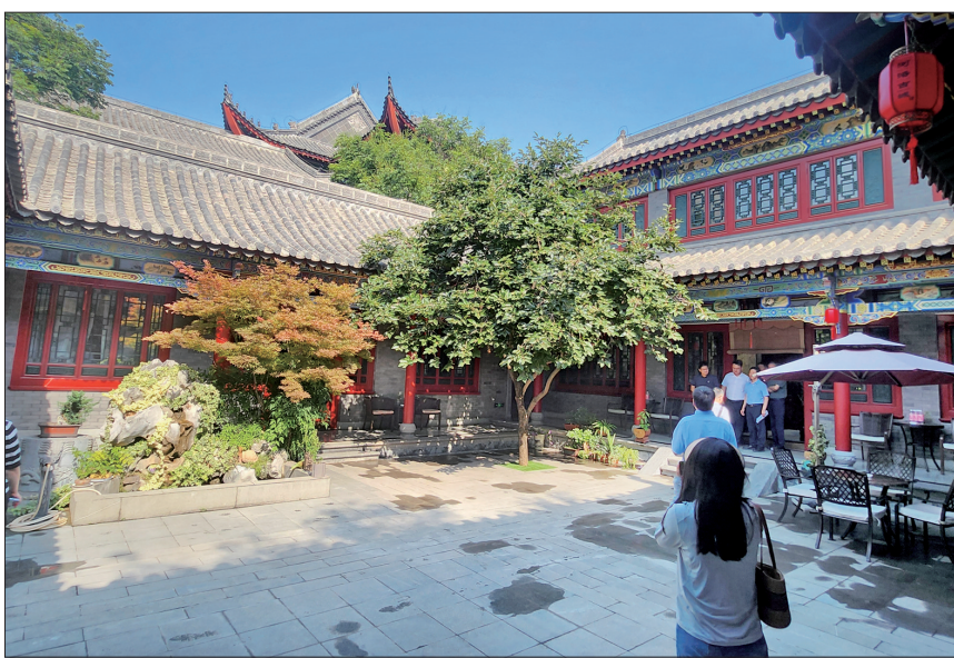
河洛古城中某民宿一角