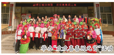
举办“欢欢喜喜闹元宵”活动

色物管会”,打造“红色物业”,建立三方联动服务机制,实现社区、物业、业主良性互动,延伸服务触角,将党建引领融合到老旧小区改造全过程。