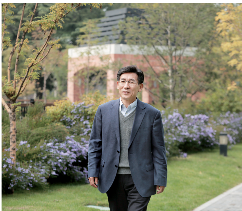
2017年10月17日,薛其坤在清华大学

首次观测到量子反常霍尔效应、首次发现异质结界面高温超导电性……他用一个个重量级科学发现,助力我国量子科学研究跻身世界第一梯队。