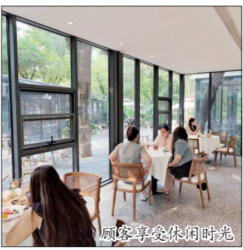
顾客享受休闲时光

夜幕四合,霓虹初上,“了了一杯”咖啡小屋又是另一番热闹景象。青年们聚在一起,摇晃酒杯,在露台吹着晚风,听着舒缓的音乐,用酒精带来的欢愉消除夏夜的燥热和一天的疲惫。