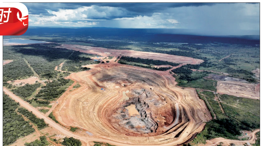
KFM项目航拍图(企业供图)

亚洲、非洲、南美洲等地区,是全球领先的铜、钼、钨、铋生产商,第一大钨生产商,也是巴西领先的磷肥生产商,企业旗下基本金属贸易业务位居全球前列,