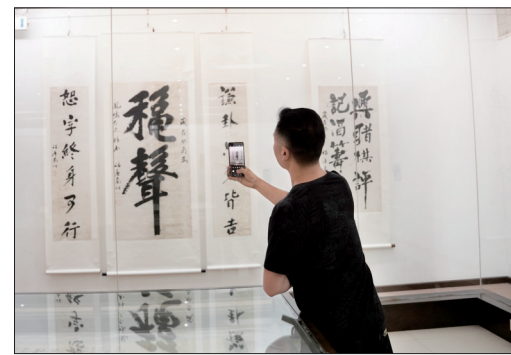
▲展览现场 ◀展出作品