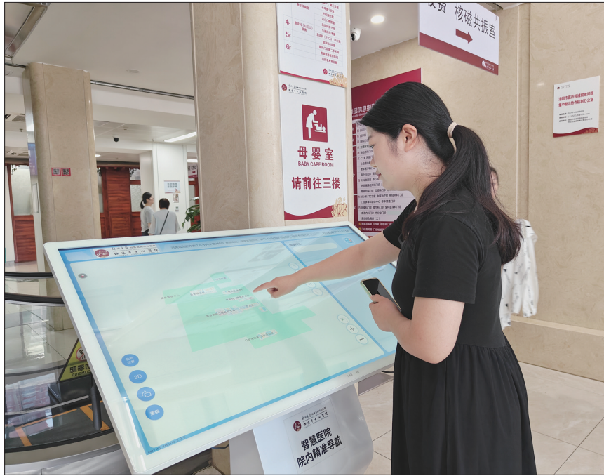
群众通过医院智慧导航实现快速就医

我市一家三级医疗机构门诊大厅,东张西望有些不知所措。发现该情况后,门诊导医护士立即上前询问。得知老人要去住院部住院,导医护士立即通知助老服务人员陪老人去办理住院手续,并护送病区。