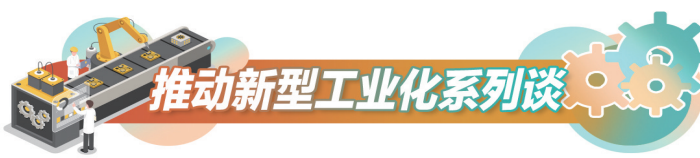
推动新型工业化系列谈

“发展新质生产力不是忽视、放弃传统产业。”在招商极致内卷的当下,我们要向存量要增量,瞄准新需求,攻关新技术,以数字化为引擎推动传统产业高端化、智能化、绿色化转型是必由之路。如此,我们才能化压力为动力、变短板为潜能,蹄疾步稳竞速产业发展新赛道。