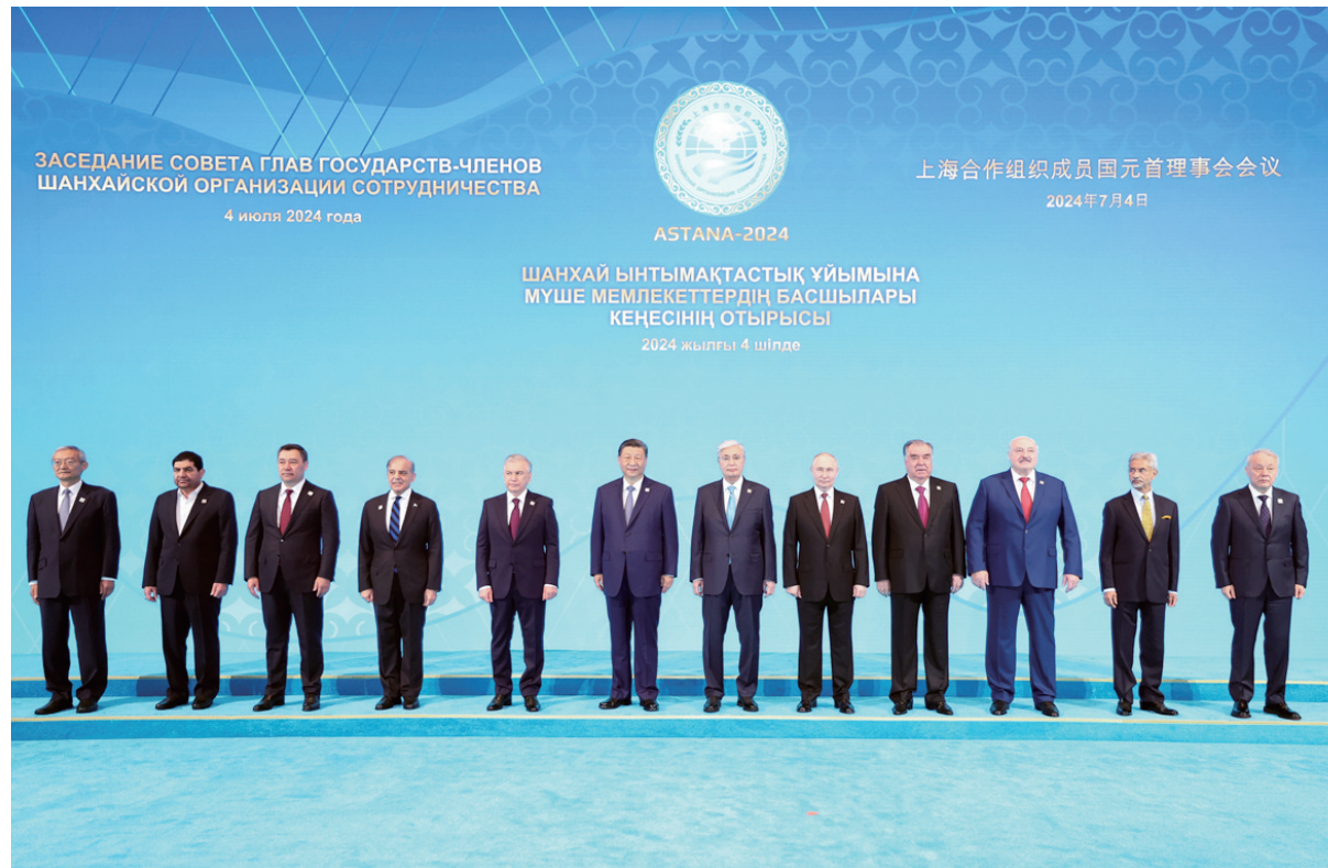
当地时间7月4日上午,国家主席习近平在阿斯塔纳独立宫出席上海合作组织成员国元首理事会第二十四次会议。这是习近平同上海合作组织成员国领导人集体合影。