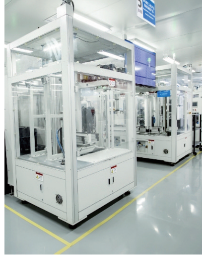
新能源汽车连接器生产车间