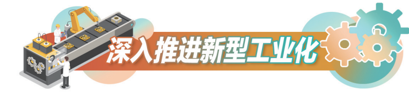
深入推进新型工业化

在新能源汽车连接器生产车间建设中,中航光电则积极建立集智能仓储、智能配送、自动化生产于一体的生产过程全流程智能化管控平台,通过集成PDM等六大系统,布置80多个开发软件接口,实现生产全过程数字化记录。