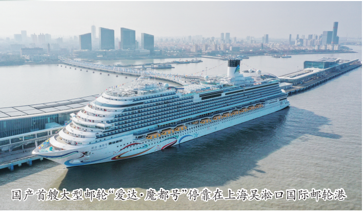
国产首艘大型邮轮“爱达·魔都号”停靠在上海吴淞口国际邮轮港