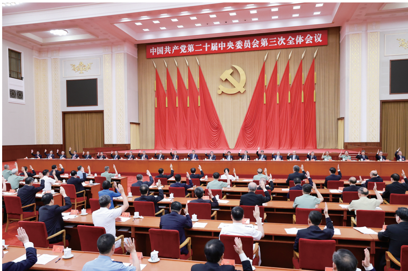
中国共产党第二十届中央委员会第三次全体会议,于2024年7月15日至18日在北京举行。中央政治局主持会议。