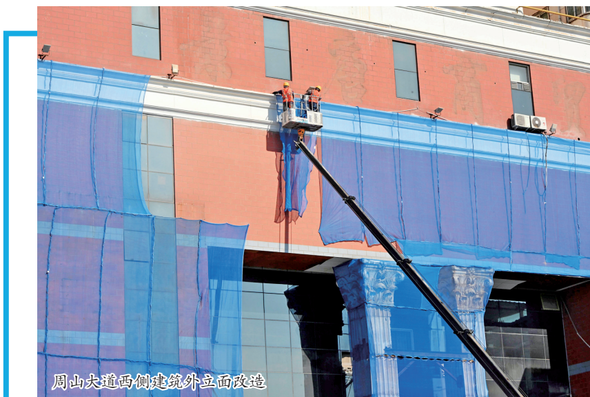
周山大道两侧建筑外立面改造