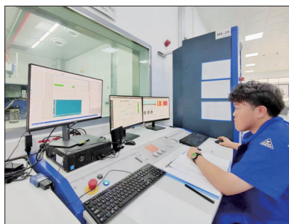
本文配图均为发动机测试现场

易泰汽车科技有限公司,招引其在洛设立子公司河南易泰,全力拓展前瞻科研、设计分析、检测验证、生产制造等全链条业务,抢抓新能源汽车产业发展红利。自去年9月投入运营以来,河南易泰已实现近千万产值,今年全年目标产值直指2000万元!