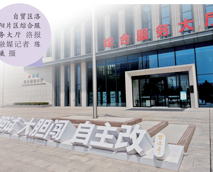
自贸区洛阳片区综合服务大厅