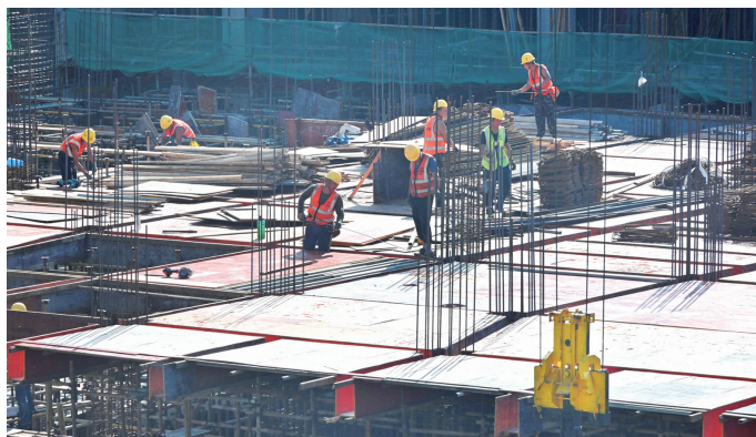
工人文化宫施工现场