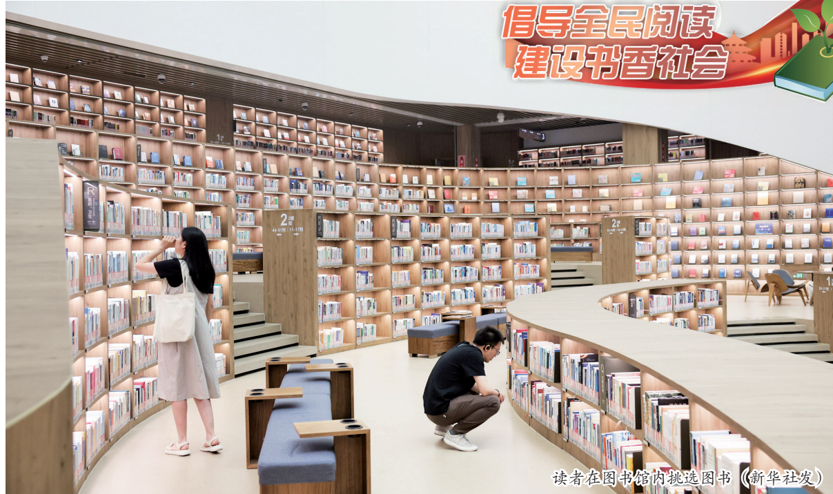
读者在图书馆内挑选图书

近两年,网络文学走上了高质量发展的快车道,精品力作频出,产业融合进一步升级,扬帆出海成绩喜人。其中,中国“网络文学+”大会发挥了不小的作用。 2017年,当网络文学行业亟待寻求一条高质量发展路径时,中国“网络文学+”大会创新提出了“+”的概念,为网络文学的发展提供无限可能。7年过去,行业对“+”的含义有了更深入的理解与期待。近日落幕的第七届中国“网络文学+”大会以“网聚创造活力 文谱时代华章”为主题,进一步丰富“+”背后的内涵,以推动网络文学高质量发展。