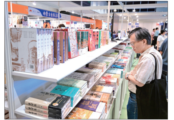
近万种内地精品图书亮相香港书展