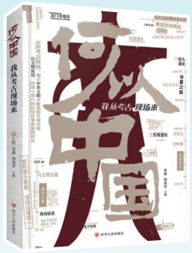
《何以中国:我从考古现场来》