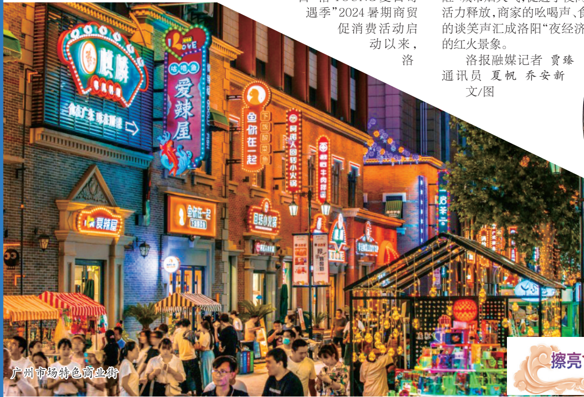
广州市场特色商业街