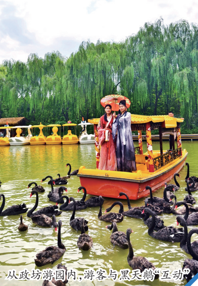
从政坊游园内,游客与黑天鹅互动