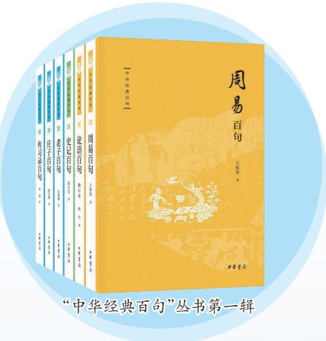
“中华经典百句”丛书第一辑

“中华经典百句”丛书第一辑近日由中华书局出版发行。这是在探索出版“中华经典通识”丛书基础上,中华书局面向广大读者的又一新尝试。