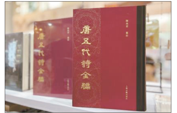
《唐五代诗全编》共50册1225卷1800余万字,收录唐诗5.5万余首、诗人4200余名,由上海古籍出版社推出

为期一周的第20届上海书展近日闭幕。盘点本届上海书展,《唐五代诗全编》正式出版,全书首次公开亮相,无疑是备受学界和大众瞩目的高光时刻。