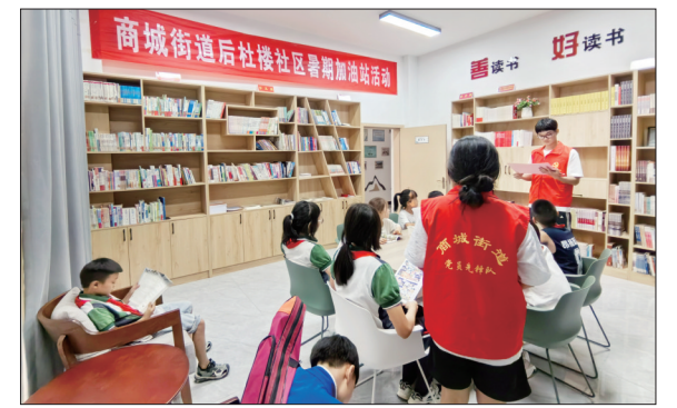
大学生志愿者在“暑期加油站”义务带娃

起势、握拳、劈掌、踢腿……近日,在偃师区缙纜镇双泉村新时代文明实践站,“暑期加油站”武术公益培训班结业仪式举行,十几名青少年在广场上整齐列队,认真地向老师、家长展示学习成果。