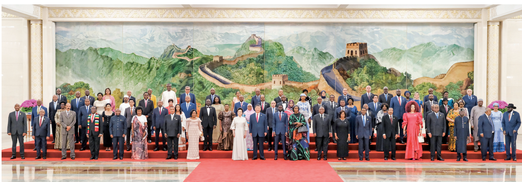
9月4日晚,国家主席习近平和夫人彭丽媛在北京人民大会堂举行宴会,欢迎来华出席中非合作论坛北京峰会的非方及国际贵宾。这是宴会前,习近平和彭丽媛同贵宾们集体合影留念。