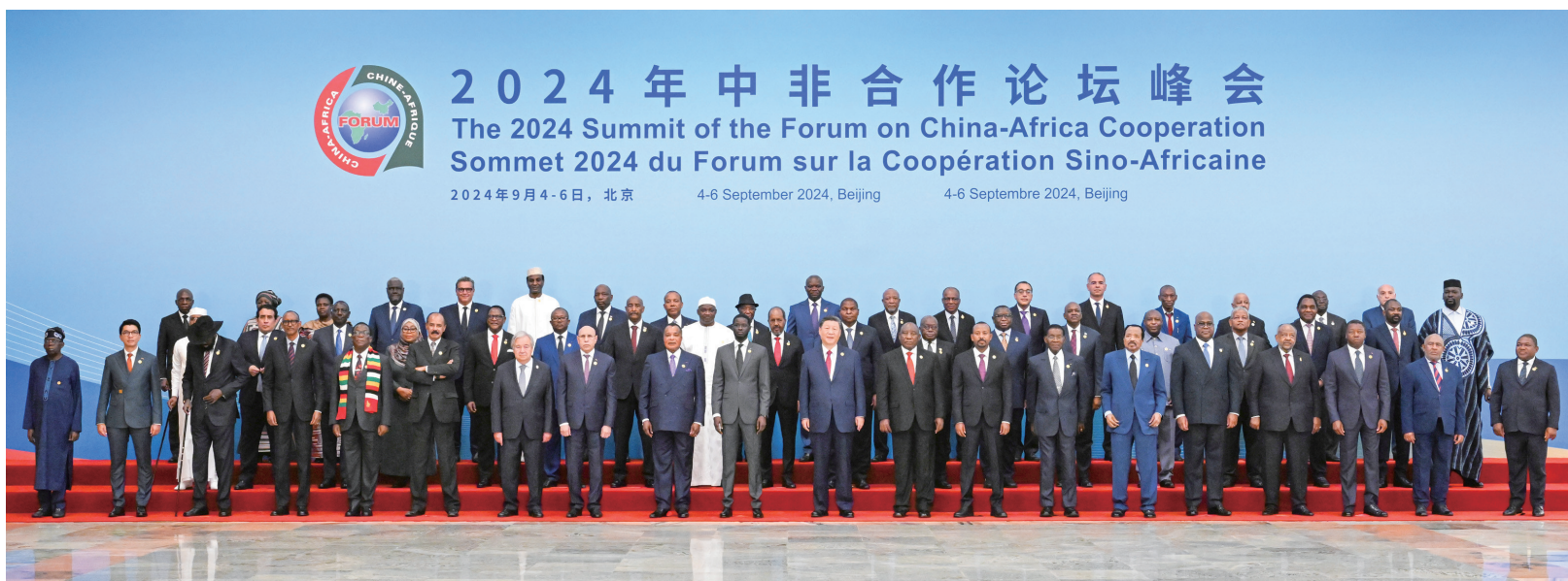
9月5日上午,国家主席习近平在北京人民大会堂出席中非合作论坛北京峰会开幕式并发表主旨讲话。这是开幕式前,习近平同出席峰会的外方领导人集体合影。