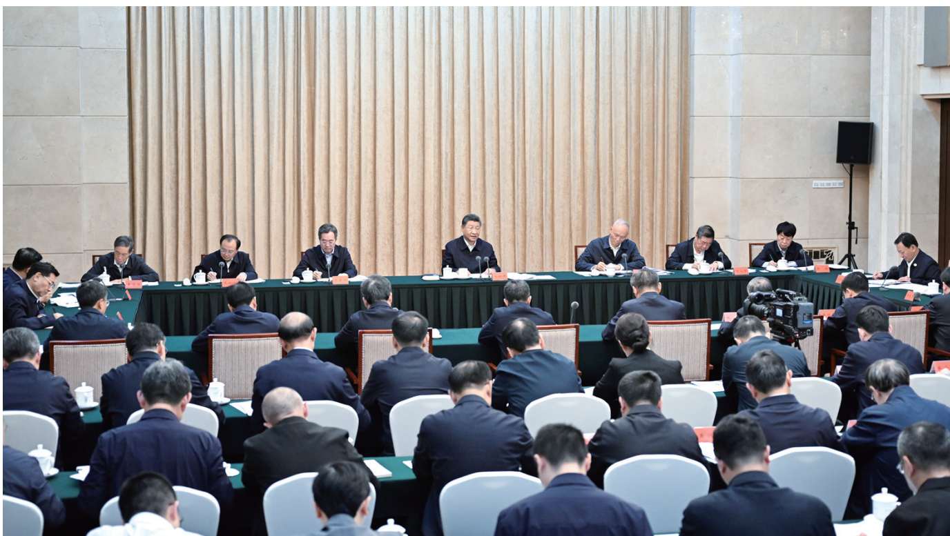
9月12日下午,中共中央总书记、国家主席、中央军委主席习近平在甘肃省兰州市主持召开全面推动黄河流域生态保护和高质量发展座谈会并发表重要讲话。

新华社兰州9月12日电 中共中央总书记、国家主席、中央军委主席习近平12日下午在甘肃省兰州市主持召开全面推动黄河流域生态保护和高质量发展座谈会并发表重要讲话。他强调,要认真贯彻党的二十大和二十届三中全会精神,牢牢把握重在保护、要在治理的战略要求,以进一步全面深化改革为动力,坚持生态优先、绿色发展,坚持