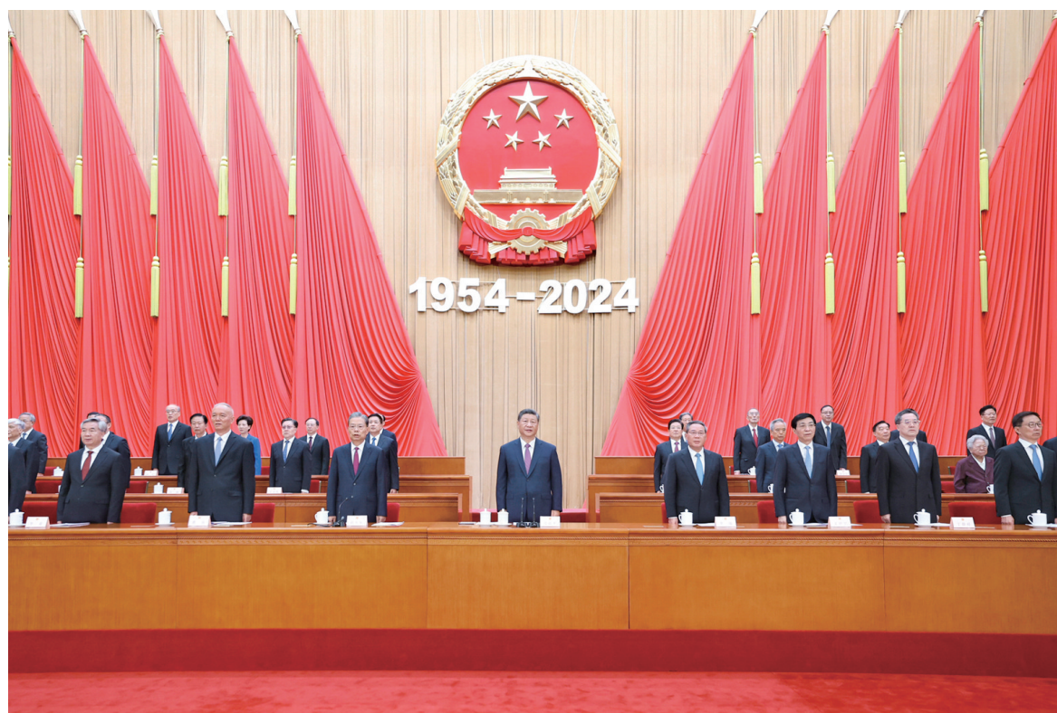
9月14日上午,中共中央、全国人大常委会在北京人民大会堂隆重举行庆祝全国人民代表大会成立70周年大会。习近平、李强、赵乐际、王沪宁、蔡奇、丁薛祥、李希、韩正等出席大会。

新华社北京9月14日电 中共中央、全国人大常委会14日上午在人民大会堂隆重举行庆祝全国人民代表大会成立70周年大会。中共中央总书记、国家主席、中央军委主席习近平出席会议并发表重要讲话。他强调,要进一步坚定道路自信、理论自信、制度自信、文化自信,发展全过程人民民主,坚持好、完善好、运行好人民代表大会制度,为实现新时代新征程党和人民的奋斗目标提供坚实制度保障。