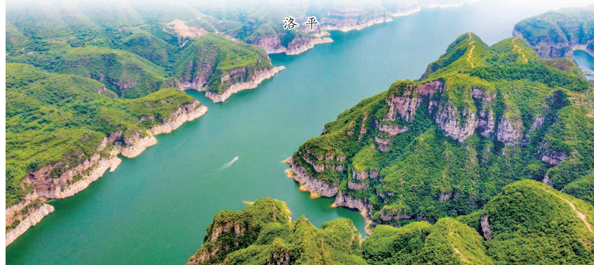
黄河岸边景美如画(摄于黄河新安段)

又是一年秋天,时间赋予黄河两岸多彩斑斓。此时的新安县石井镇控马村洛阳华洋生态科技园,天水一色、青山环拱、林海连绵。曾经,这里是漫山遍野的飞沙走石;而今,历经21年卵石垦壤、播种插绿,这里已成为四季常绿、四季有花、四季有果的“中原塞罕坝”。黄河之畔,一片荒山何以换了人间?因为有一群人风雨无阻,誓把荒山变青山。他们中,有企业人员,有林业专家,也有周边村民,是他们守望荒坡二十一年,植此黄河千亩青山,用青春、热血甚至生命,谱写了一曲“造林、造富、造福”的绿色凯歌,诠释了河洛儿女接力保护黄河生态、让黄河造福一方的拳拳深情。