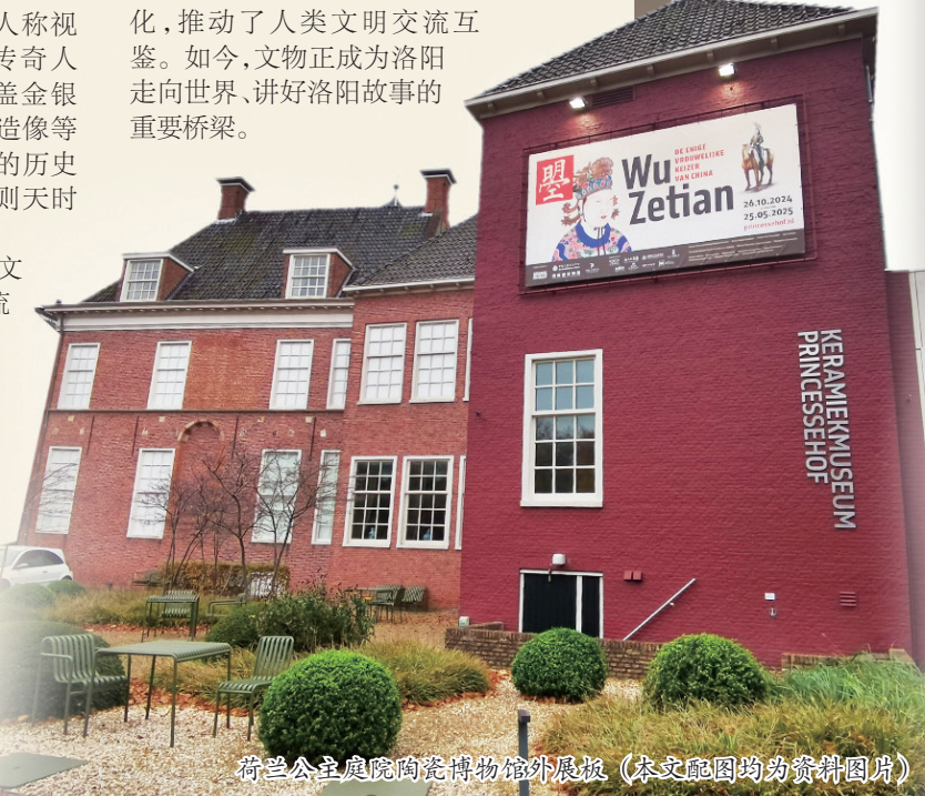
荷兰公主庭院陶瓷博物馆外展展(本文配图均为资料图片)

化,推动了人类文明交流互鉴。如今,文物正成为洛阳走向世界、讲好洛阳故事的重要桥梁。