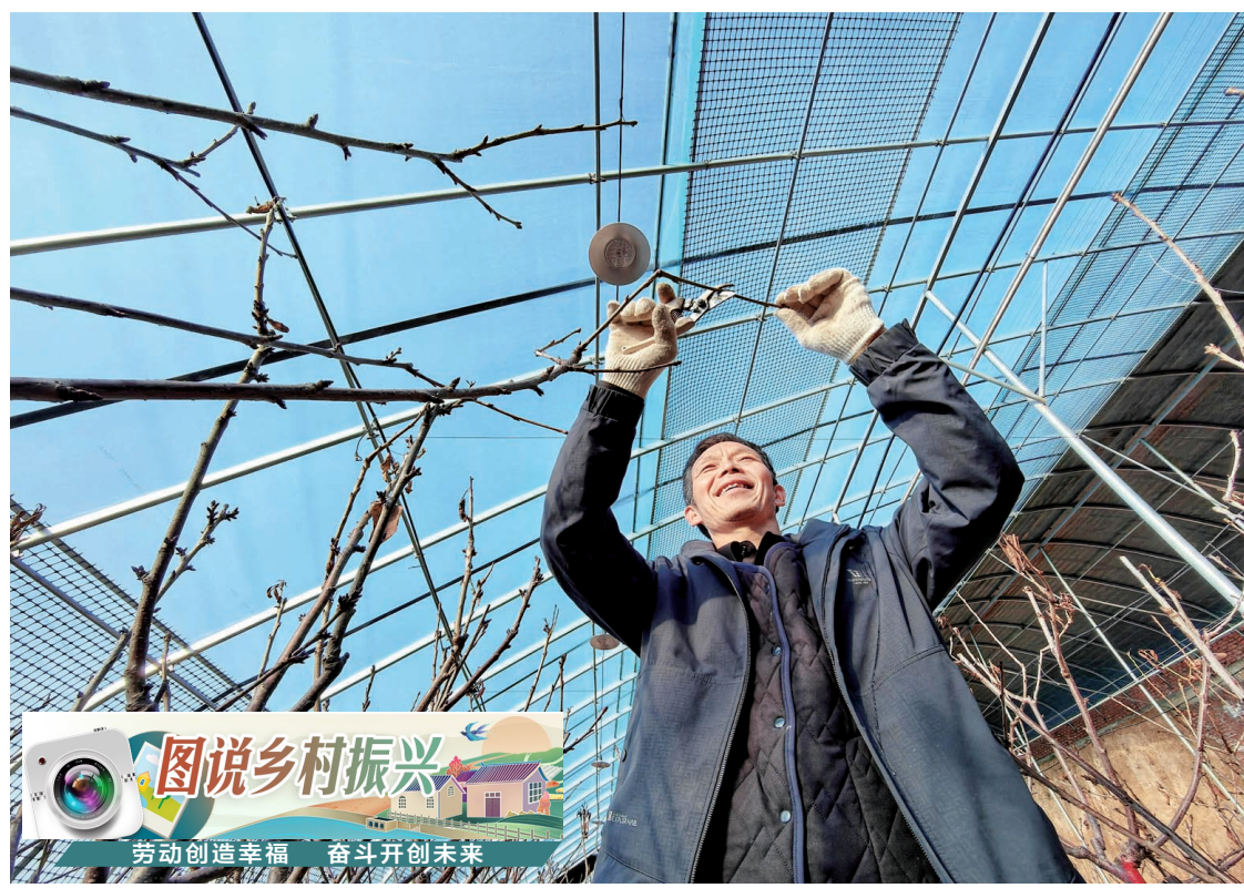
图说乡村振兴 劳动创造幸福 奋斗开创未来