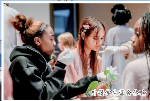
外籍学生营地体验