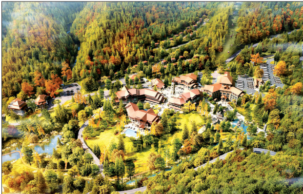
五马寺综合服务区效果图