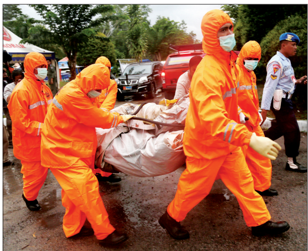
4日，在印度尼西亚的庞卡兰布翁，印尼国家搜救中心工作人员搬运打捞出亚航失事客机的部件