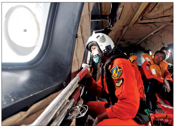
4日，在印度尼西亚哇哇海上空，印尼空军人员透过直升机舷窗搜寻遇难者