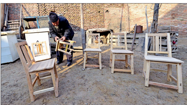
送给乡邻的小家具