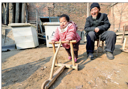
为重孙女打造的学步车