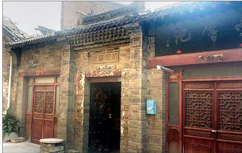
八公司旧址

清末,玉器商人赵培荣购买玉皇阁北侧的空地,建赵氏玉器作坊。1927年冬,豫西行政长官王玉堂下令将玉虚观道长孙教承和道士驱散,玉虚观划归明德中学。明德中学将玉皇阁卖给赵培荣,赵培荣将玉皇阁拆除,建惠友楼,与原玉器作坊连成一体,成为五间三进宅院,将此院定名为惠友堂,请清末进士林东郊题写匾额,挂于大门前。