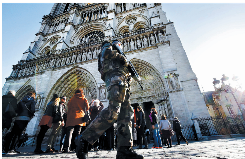
11月15日,在法国首都巴黎的巴黎圣母院外,安全人员持枪巡逻

袭击事件震惊法国及国际社会,有人将其比作法国的“9·11”事件。观察人士认为,发生这种事件是法国等欧洲国家面临的恐怖威胁不断积累后的一次爆发。欧美等西方国家应进行深刻反思,防止类似悲剧重演。