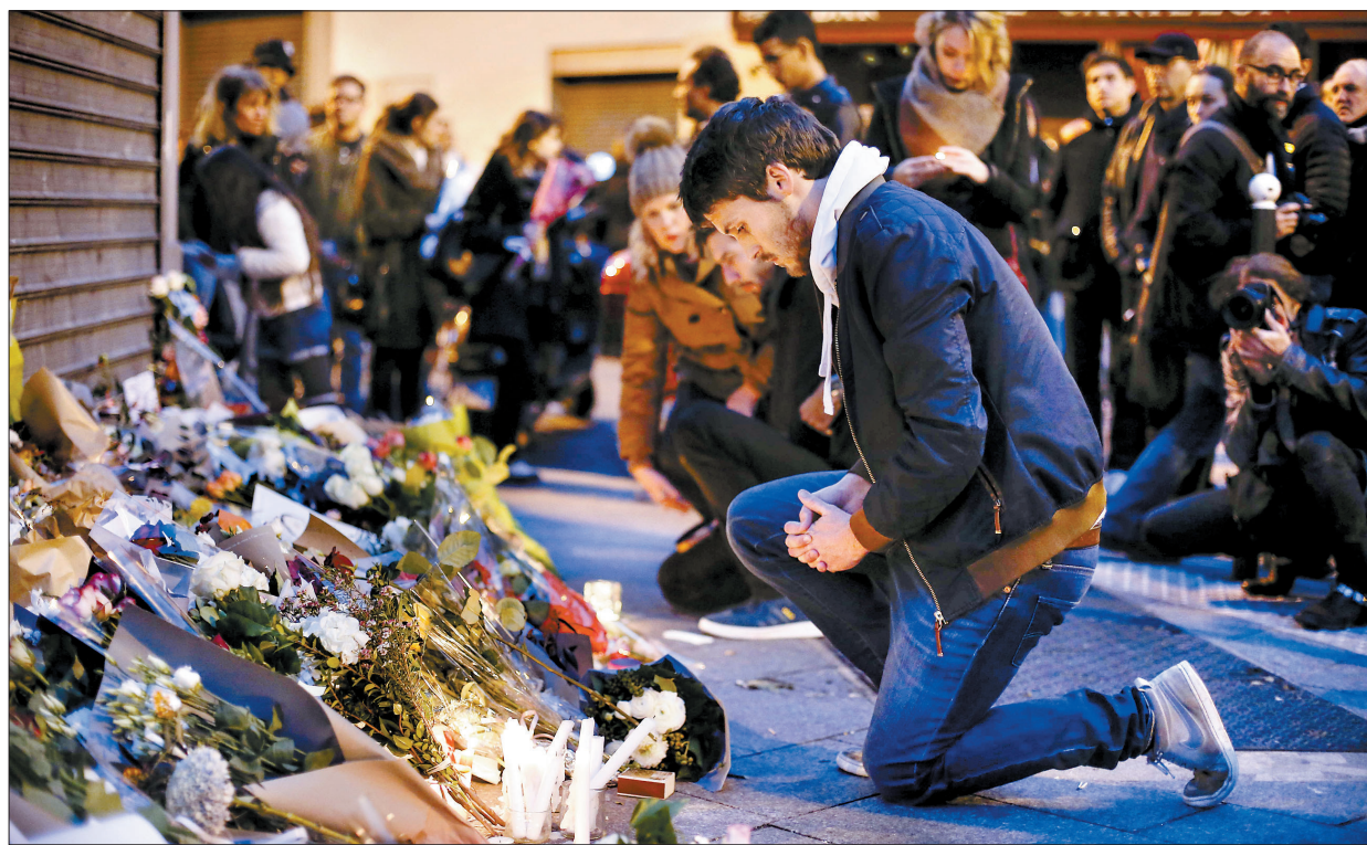
11月14日,在法国巴黎发生枪击事件的餐馆外,民众摆上鲜花和蜡烛,悼念遇难者

比利时司法大臣科恩·赫恩斯告诉记者,租车的是一位比利时人。眼下不清楚他是否在7名毙命的恐怖分子当中。巴黎检察官弗朗索瓦·莫林说,警