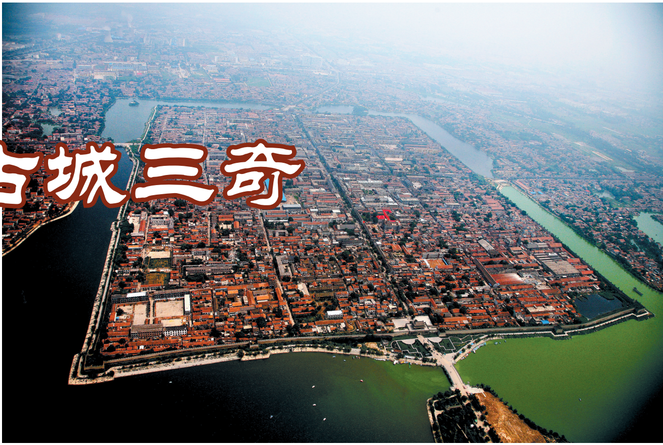
俯瞰护城河环绕商丘古城

改朝换代,战火频仍,黄河水患,都是旧城毁掉的原因。但先民对这方宝地不离不弃,在南北十里的范围内,毁了建,建了再建,故而形成“城摞城”奇观。此二奇也。