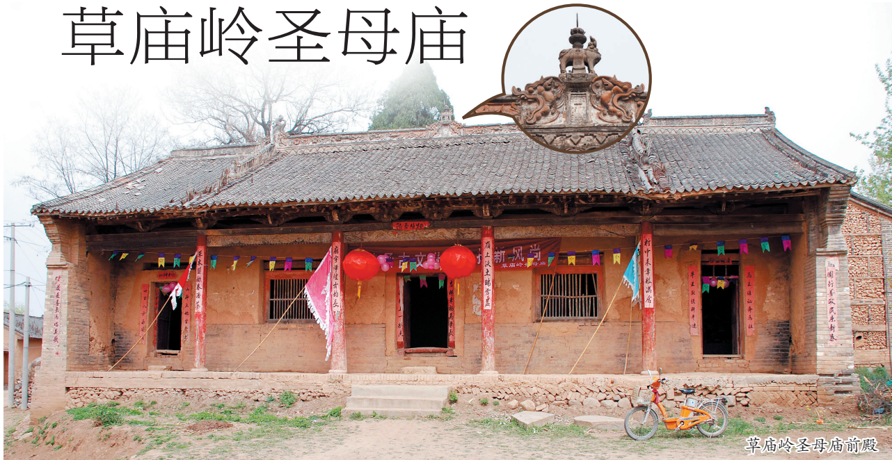
草庙岭圣母庙前殿