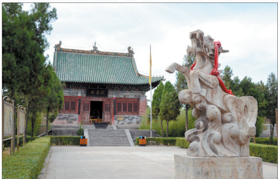
龙马负图寺的龙马雕塑(资料图片)

图河为沿岸居民带来如画的美景,也赋予了万千农家丰收的欢乐,“图河夏涨”被誉为“孟津十景”之一,传为佳话。