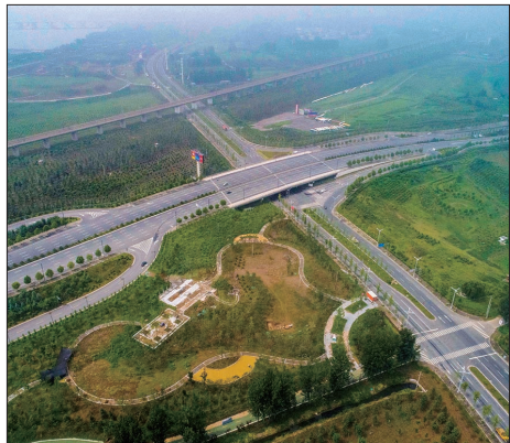
立体的东环路