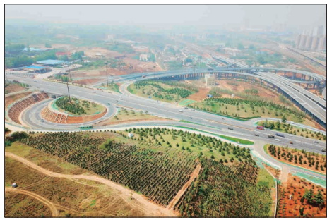
南环路王城大道互通立交桥