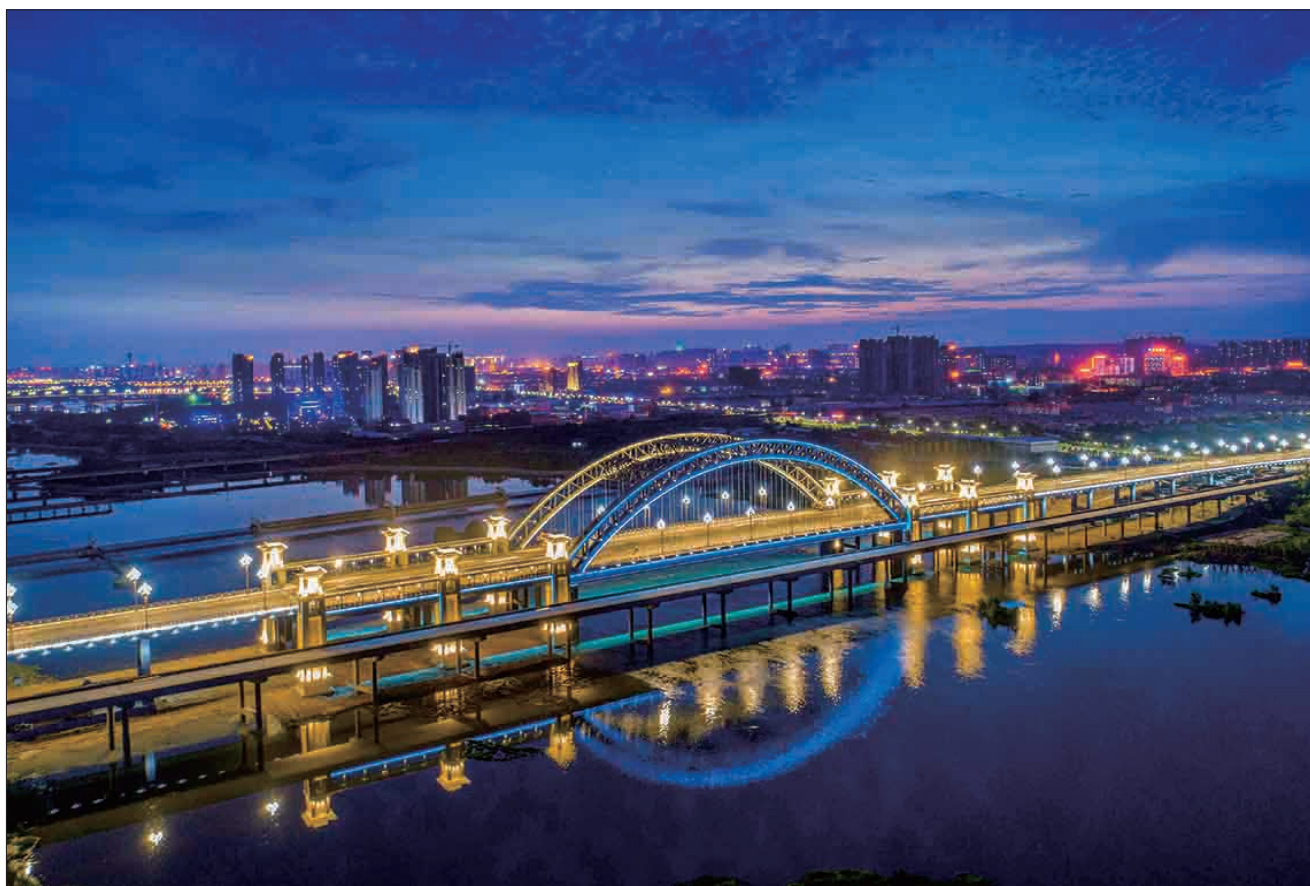
东环路跨洛河大桥夜景

“在一家破产企业的征迁过程中,为保障资金到位,洛政新龙公司从维护社会稳定、保障项目顺利推进的大局出发,采取报经政府批准,先预付、再报审结算的方式,从原本紧张的资金中拿出近1亿元,保障了项目如期推进。同时,公司派专人整理报送征迁补偿资料等。”洛政新龙公司征迁部经理苏适章说。东南环项目共完成沿线移动、联通、电信、有线4家通信单位的线路迁移约9.8公里;110~220kV超高压线路迁建1000多米,10kV电力线路迁建近12公里;4家部队7处军事光缆12368米;协调东环路北控水务原水管管道迁建1465米,水源井10kV电力专用线迁建1600米;协调完成南环路郑西高铁10kV龙客线和东环路焦柳铁路10kV娄铁线的电力迁建。迁改费用累计近亿元。