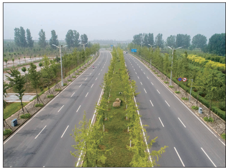
宽阔的东环路