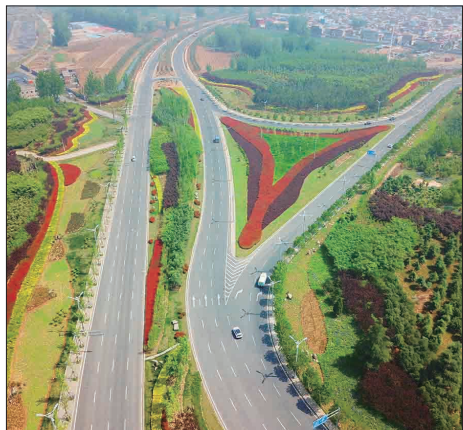
互通的东环路