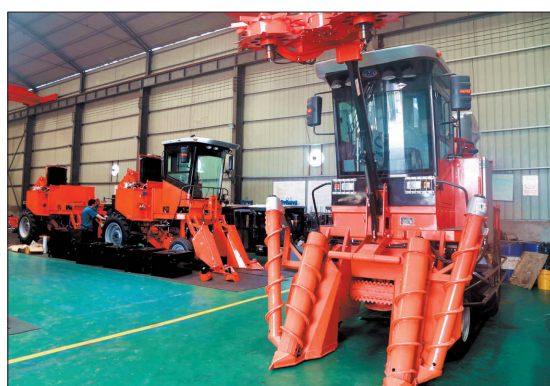
洛阳辰汉农业装备科技有限公司生产的甘蔗联合收割机