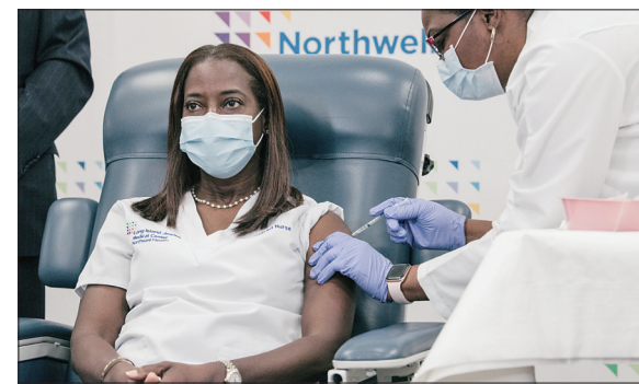
美国开始新冠疫苗接种

拜登14日晚在特拉华州威尔明顿市发表讲话,称新一届政府面临的紧迫任务包括控制新冠肺炎疫情、推动新冠疫苗接种、为美国人提供更多经济救助以及重建美国经济。