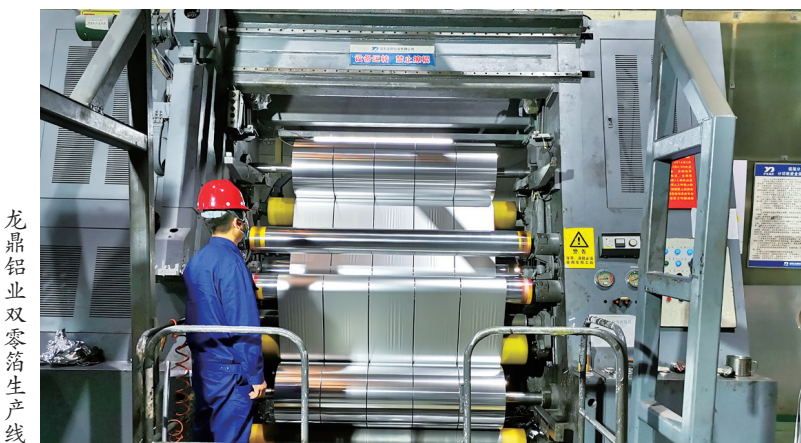
龙鼎铝业双零箔生产线

“我们这个项目在发展壮大电子功能材料的同时,可填补国内高端硅基材料的空白。”中硅高科电子信息材料转型升级项目负责人介绍。