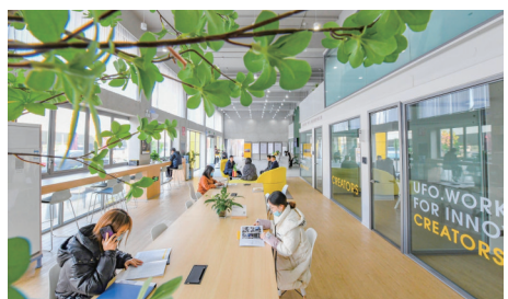
西工区硅基创新产业社区首期共享办公区