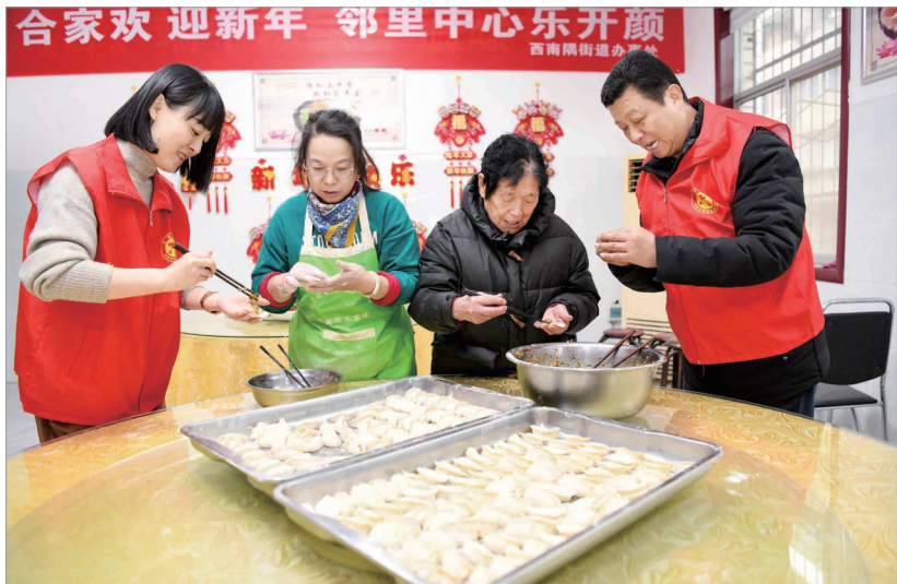
春节临近,老城区西南隅街道在辖区邻里中心近日开展“合家欢 迎新年 邻里中心乐开颜”活动。工作人员和志愿者进行厨艺大比拼,邀请辖区孤寡老人、身边好人齐聚一堂分享美食,迎接新春。