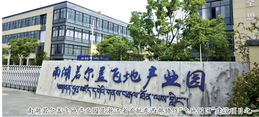
南湖若尔盖飞地产业园是浙江省首批东西部协作“飞地园区”建设项目之一