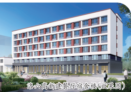
洛六高新建餐厅宿舍楼(效果图)

近年,市委市政府把教育事业摆在优先发展的战略地位,坚持以创新引领教育事业高质量发展,以战略眼光谋划实施了一系列优化教育资源配置、改善学生学习生活环境的举措。未迁建高中改造提升项目,便是其中一项重要内容。8所未迁建高中为什么要进行改造提升?此次改造提升都包含哪些内容?成效如何?本期深一度深入走访8所高中,为您详细解答。