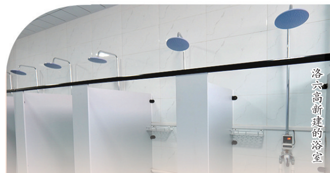
洛六高新建的浴室

市住建局相关负责人表示,8所高中的改造提升类施工项目已基本完工,科大附中、理工附中餐厅改造因施工难度较大,改造周期长,计划在12月底前完工。(下转03版)