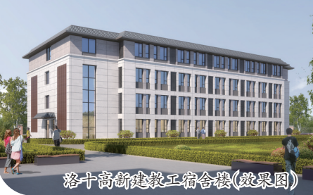
洛十高新建教工宿舍楼(效果图)