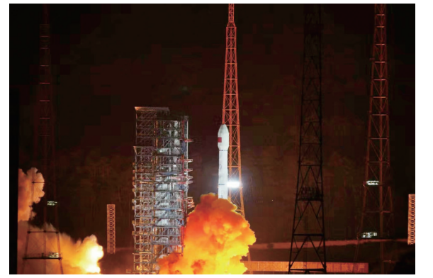
我国成功发射中星6E卫星

在哀乐声中缓步来到周铁农同志的遗体前肃立默哀,向周铁农同志的遗体三鞠躬,并与周铁农同志亲属一一握手,表示慰问。党和国家有关领导同志前往送别或以各种方式表示哀悼。中央和国家机关有关部门负责同志,周铁农同志生前友好和家乡代表也前往送别。