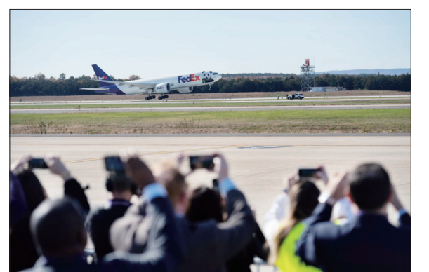
旅美大熊猫“美香”一家三口启程回国

11月9日,人们在德国柏林举行的柏林墙倒塌34周年纪念活动上点燃蜡烛。当日,德国首都柏林举行活动纪念柏林墙倒塌34周年。