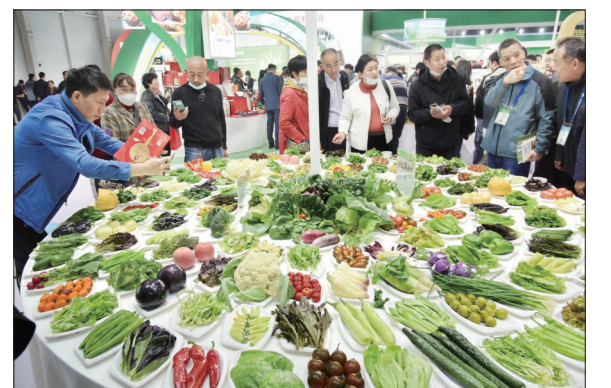
第二届中国农交会在青岛开幕

这是11月9日在印度尼西亚西爪哇省芝拉塔水库拍摄的芝拉塔漂浮光伏项目升压站和漂浮阵列(无人机照片)。由中国企业承建的光伏项目9日在印度尼西亚西爪哇省芝拉塔水库实现全容量并网发电。印尼总统佐科出席并网发电仪式并表示,印尼拥有大型新能源发电项目的梦想终于实现,这是东南亚最大的漂浮光伏项目。据了解,项目总装机容量为192兆瓦,光伏场区水面部分共13个光伏阵列,总覆盖面积约250公顷。