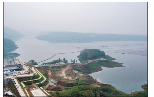
中企承建东南亚最大漂浮光伏项目在印尼并网发电

11月9日19时23分,我国在西昌卫星发射中心使用长征三号乙运载火箭,成功将中星6E卫星发射升空,卫星顺利进入预定轨道,发射任务获得圆满成功。