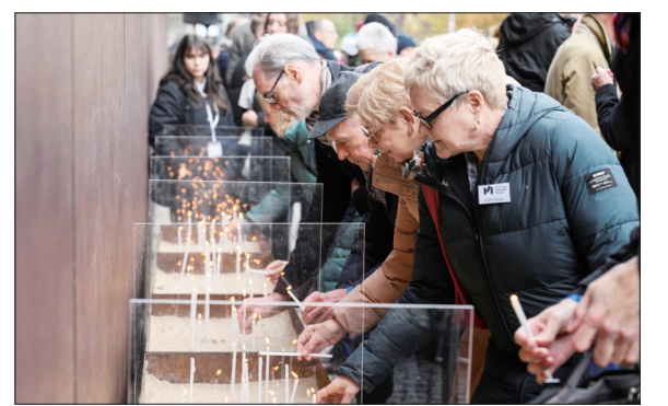
德国纪念柏林墙倒塌34周年

11月9日,参会者在展会上参观拍摄。当日,第二届中国国际农产品交易会在山东省青岛市开幕,近3000家企业携2万余种展品参展,吸引各地专业采购商逾3万人参加。本届农交会由农业农村部、山东省人民政府共同主办,以“奋进新征程、强农促振兴”为主题,设置了粮油、果蔬、水产等11个展区,展览面积12万平方米。