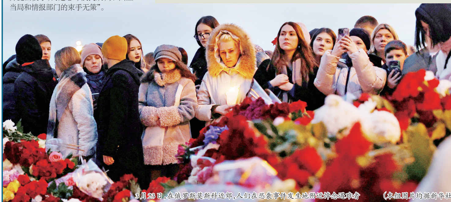
3月23日,在俄罗斯莫斯科近郊,人们在恐袭事件发生地附近悼念遇难者