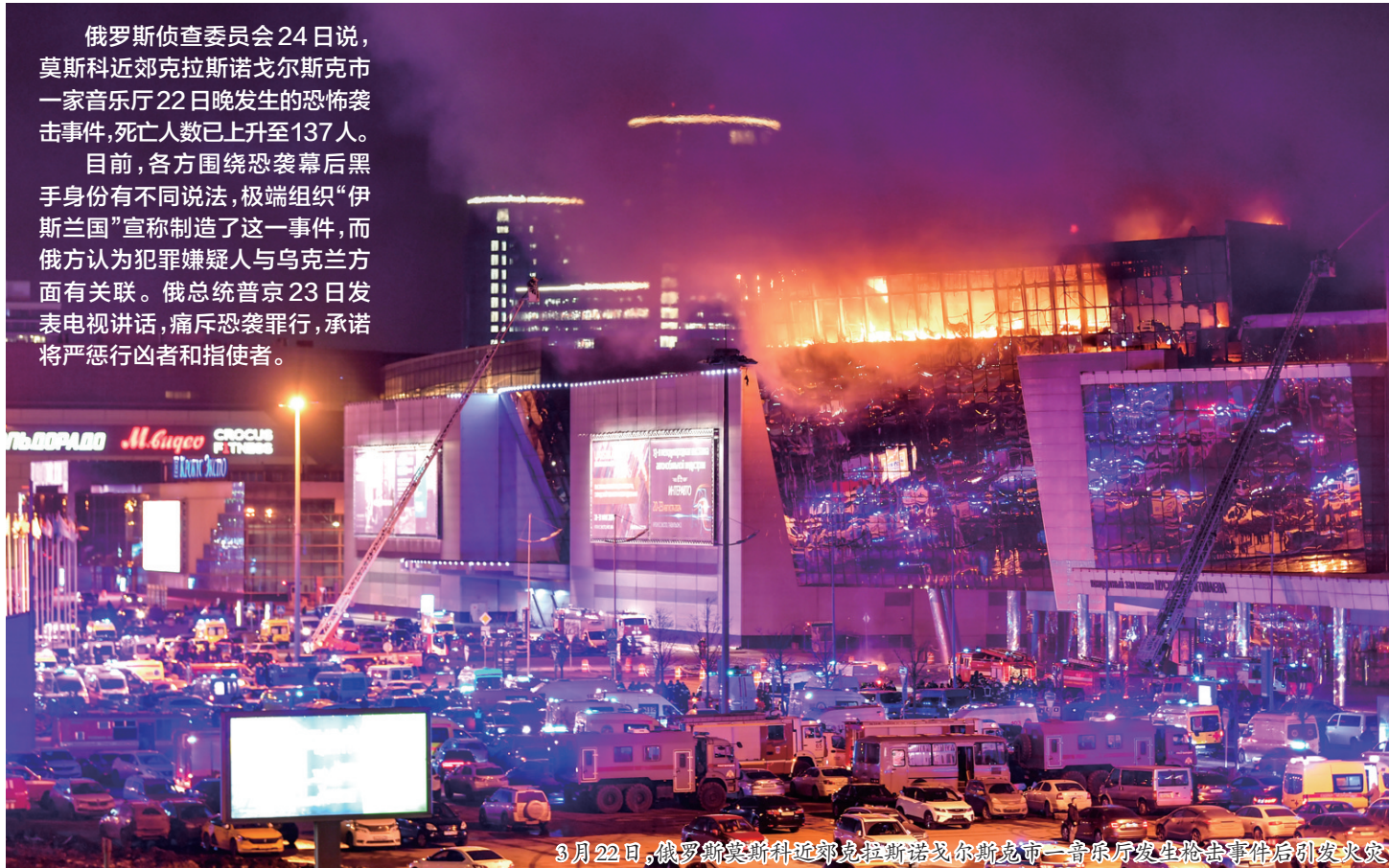
3月22日,俄罗斯莫斯科近郊克拉斯诺戈尔斯克市一音乐厅发生枪击事件后引发火灾。

习近平强调,中方反对一切形式的恐怖主义,强烈谴责恐怖袭击行为,坚定支持俄罗斯政府维护国家安全稳定的努力。