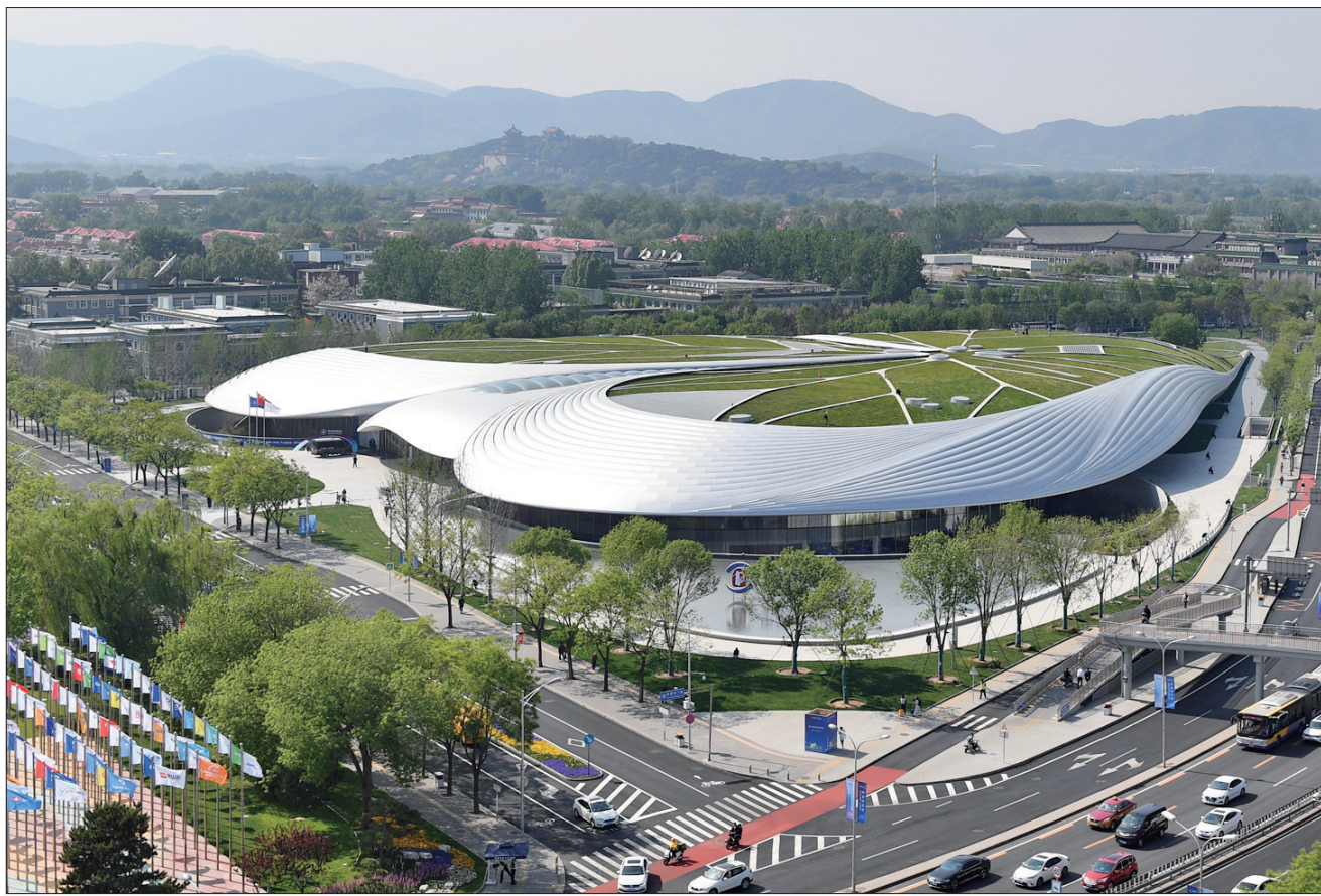
2024中关村论坛年会举办地——中关村国际创新中心

本月刚满周岁的北京芯智达神经技术有限公司自主研发的“北脑二号”,在今年中关村论坛年会上经发布,即惊艳四座——“它解决了大规模单细胞信号长期稳定记录和解码的国际难题,填补了我国高性能侵入式脑机接口的