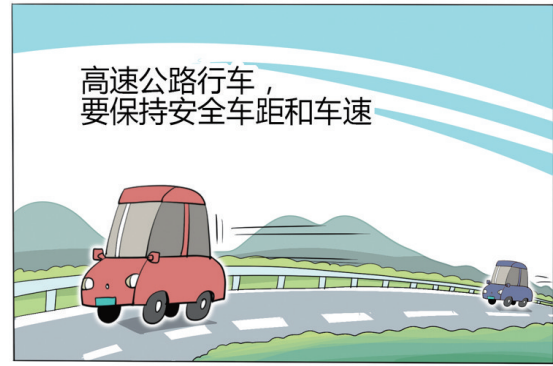
“五一”出行安全提示