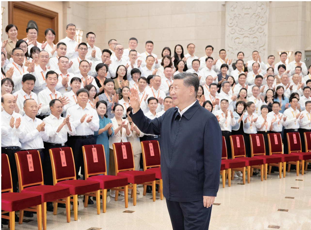
9月9日,党和国家领导人习近平、李强、蔡奇、丁薛祥等在北京接见参加庆祝第四十个教师节暨全国教育系统先进集体和先进个人表彰活动代表。

新华社北京9月10日电 全国教育大会9日至10日在北京召开。中共中央总书记、国家主席、中央军委主席习近平出席大会并发表重要讲话。他强调,建成教育强国是近代以来中华民族梦寐以求的美好愿望,是实现以中国式现代化全面推进强国建设、民族复兴伟业的先导任务、坚实基础、战略支撑,必须朝着既定目标扎实迈进。