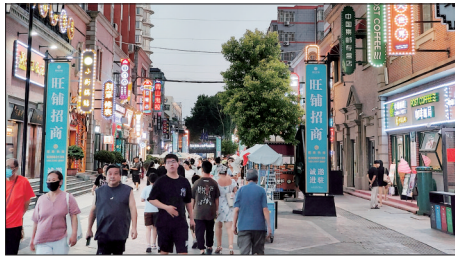
广州市步行街人流涌动