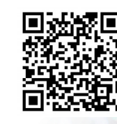
扫码阅读文章《降息幅度超预期 美联储货币政策解读》

以美元计价借贷的国家清偿债务压力骤增。 在经济全球化和资本市场开放的条件下,美联储一轮又一轮加息、降息形成的“美元潮汐”让世界陷入一个又一个“繁荣-危机-低迷”的循环之中。在这背后,为“任性”的美国货币政策撑腰的正是美元霸权。早在半个多世纪前,法国前总统戴高乐就曾形象地指出,“美国享受着美元所创造的超级特权和不流眼泪的赤字,用一钱不值的废纸去掠夺其他民族的资源和工厂”。