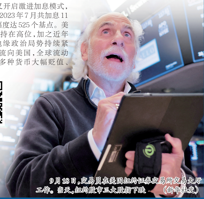
9月18日,交易员在美国纽约证券交易所交易大厅工作。当天,纽约股市三大股指下跌。