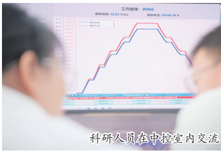
科研人员在中控室内交流