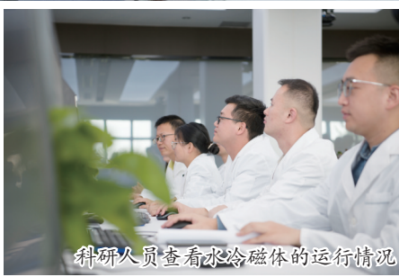
科研人员查看水冷磁体的运行情况